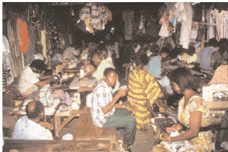
Atelier de couture, marché de Bouaké, Côte d'Ivoire.

La réorientation des politiques de développement sur le front de la lutte contre la pauvreté pose un redoutable défi aux statisticiens en termes de suivi et d'évaluation. Il ne s'agit plus seulement de s'en tenir aux grands agrégats macro-financiers (croissance, inflation, déficit public, etc.), mais de mesurer les niveaux et l'évolution du bien-être des populations, avec toute la complexité que revêt ce concept, afin d'apprécier l'efficacité des politiques et éventuellement de les réorienter. Il est donc nécessaire de concevoir une nouvelle génération d'enquêtes auprès des ménages qui remplissent ces objectifs. A côté des enquêtes lourdes du type LSMS (Living Standard Measurement Surveys) ou EDS (Enquêtes démographiques et de santé)