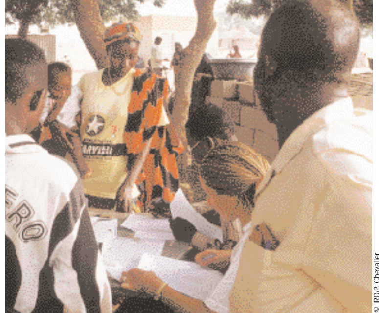
Enquête alimentaire auprès de mères de famille au Burkina Faso.

L'approche par les besoins essentiels, défendue par le PNUD et reprise dans le rapport de la Banque mondiale en 1990, a complété l'analyse strictement monétaire. Cette conception admet qu'il ne suffit pas que les revenus augmentent pour que les individus aient un meilleur accès, par exemple aux soins de santé ou à l'éducation, dis-