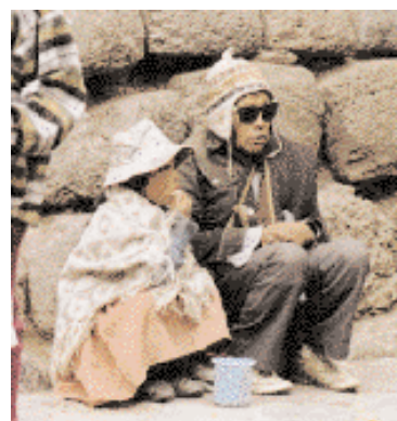
Mendiant à Cuzco, Pérou.

On constate aussi que près d'un quart des ménages se trouve en situation de « pauvreté permanente », ce qui représente plus de la moitié du total des pauvres observés chaque année, l'autre moitié étant composée des « pauvres transitoires ». Au cours de la période